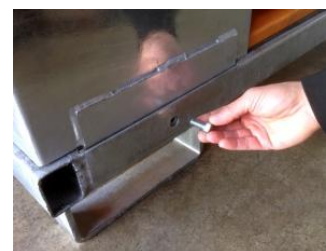
FIJACION DE CANTONERAS

* EMBALAJE DEL BOX: Mediante encaje, tornillería y pasadores