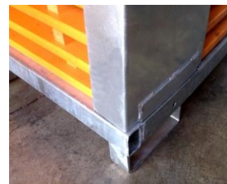
ENCAJE DE CANTONERAS